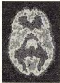
Imagen P.E.T. del cerebro, una de las técnicas más usadas en neurociencia cognitiva.

anteriormente expuestos, se manipula la conducta del organismo para ver los cambios en la actividad cerebral, pudiéndose usar como sujeto experimental a la persona neurológicamente sana (Junqué y Barroso, 1994).