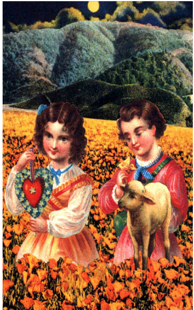
«Mellon collie and the infinite sadness» The Smashing Pumpkins

Tamayo, L. (2001). Del síntoma al acto. Reflexiones sobre los fundamentos del psicoanálisis . Serie Psicología. Querétaro. Universidad Autónoma de Querétaro.