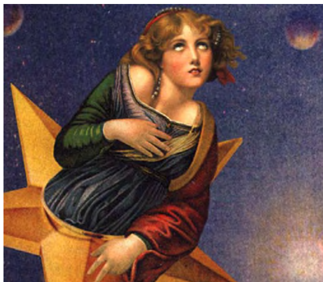
«Mellon collie and the infinite sadness» The Smashing Pumpkins

La melancolía, desde la etimología, es una especie de neurastenia, también así llamada por Freud. Lo que me parece importante resaltar de esta definición etimológica es la declinación del griego al hispano-árabe en donde también se observa una relación directa de la melancolía con la locura. Desde la antigüedad del mundo griego, desde Homero a Aristóteles, Hipócrates y los Estoicos, se deja notar esa relación entre locura y melancolía.